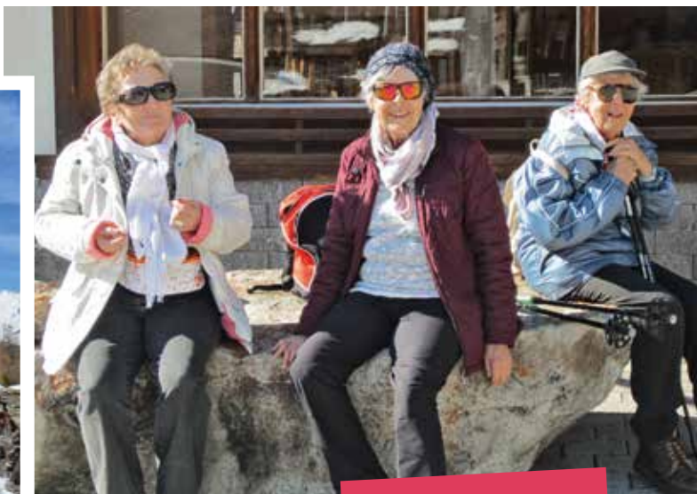
Evolène mars 2017