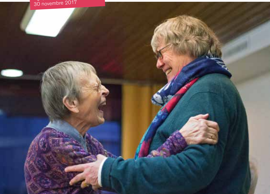
Agape 30 novembre 2017